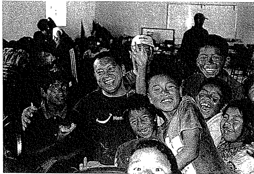
Ein Henkel-Mitarbeiter im Einsatz für das MIT-Jubiläumsprojekt in Guatemala. Das Unternehmen ist eines der wenigen in Deutschland, das Corporate Volunteering-Aktivitäten auch im Ausland betreibt.