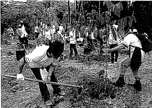
Baumpflanzungen beim Global Volunteer Day der Deutschen Post DHL. Kurzfristige Einsätze sind ein guter Start ins Corporate Volunteering, meinen Experten.

tätig sind, können zudem durch Geld- und Sachspenden – sogenanntes „Matched Funding“ – von den Unternehmen unterstützt werden.